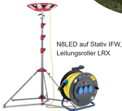
N8LED auf Stativ IFW, Leitungsroller LRX

Der Rekordversuch mit dem „größten Fackelbild der Welt“ fand am 16.10.2021 auf dem Flugplatz Gera-Leumnitz statt und wurde vom Rekordteam organisiert.