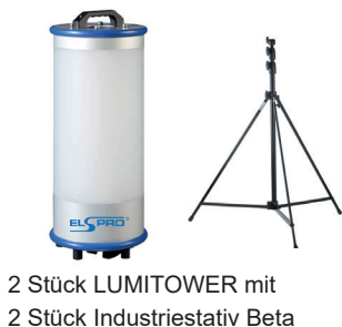
2 Stück LUMITOWER mit 2 Stück Industriestativ Beta

Mit folgenden Produkten unterstützte die ELSPRO das Rekordteam: