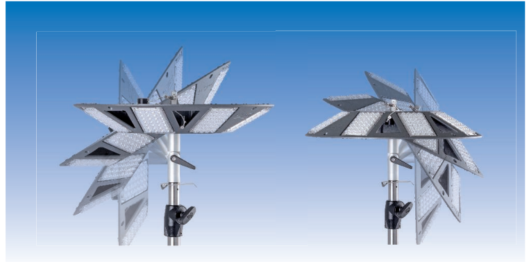
- Kippgelenk und Stativadapter ermöglichen eine individuelle Ausrichtung -

Wie gut ist die N8LED zu transportieren und zu lagern?