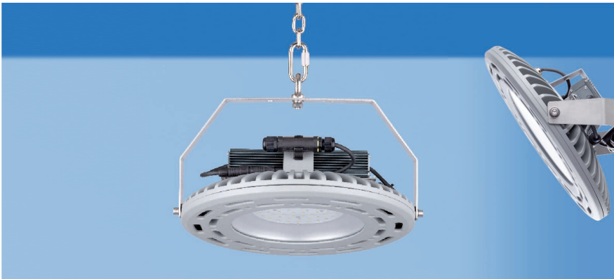
- DISCLED - eine Runde Sache zum Beispiel für Hallenbeleuchtung -

Kompakt, unkompliziert und selbst-erklärend erstrahlt die ELSPRO Wand- und Deckenleuchte DISCLED durch ihr ansprechendes Design. Sie ist eine Allroundleuchte, die sich in unterschiedlichsten Winkeln sehr gut anbringen lässt.